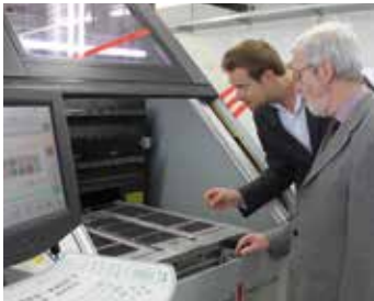
Produzione specializzata di circuiti stampati