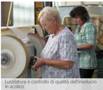
Lucidatura e controllo di qualità dell'involucro in acrilico