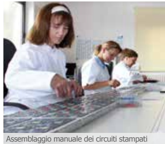
Assemblaggio manuale dei circuiti stampati