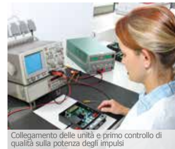
Collegamento delle unità e primo controllo di qualità sulla potenza degli impulsi

CWT – Christiani Wassertechnik GmbH Köpenicker Str. 154 10997 Berlino Germania