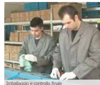
Imballaggio e controllo finale

tel: +49 (0)30 - 23 60 77 8-0 fax: +49 (0)30 - 23 60 77 8-10 email: info@cwt-international.com web: www.cwt-international.com