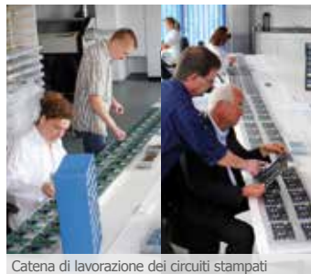
Catena di lavorazione dei circuiti stampati