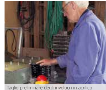
Taglio preliminare degli involucri in acrilico