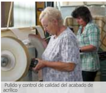
Pulido y control de calidad del acabado de acrílico