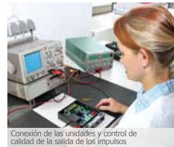
Conexión de las unidades y control de calidad de la salida de los impulsos