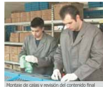
Montaje de cajas y revisión del contenido final

tel: +49 (0)30 - 23 60 77 8-0 fax: +49 (0)30 - 23 60 77 8-10 email: info@cwt-international.com web: www.cwt-international.com