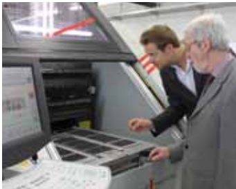
Producción especializada en circuitos impresos