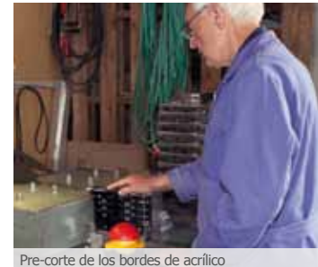
Pre-corte de los bordes de acrílico