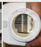
Clorador para piscina