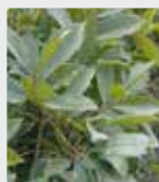
Plantas em estufa