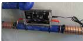
Vulcan 5000 installé chez un particulier