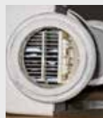
Filtre de piscine