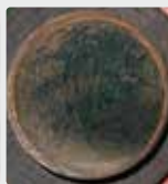
Biofilm présent sur un tuyau