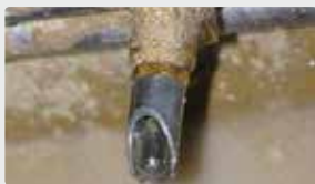
Abrevoir parfaitement propre