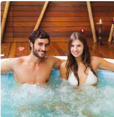
Hotel jacuzzi i wellness-område