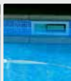
Kalk i svømmebassiner